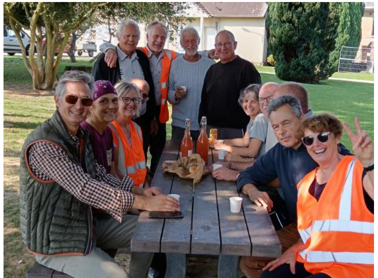
La soirée de remerciements aux bénévoles de fin d'année 2024.