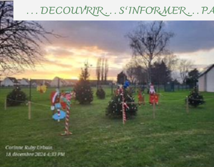
Cortine Ruby Urbain 18 décembre 2024 4:33 PM